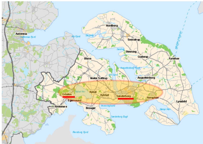
Figur 1: Kort over Sønderborg kommune

De to selskaber har i lang tid haft et godt samarbejde på forskellige områder, og i slutningen af 2016 blev der således indgået en formel administrationsaftale mellem parterne, som betyder Sønderborg Fjernvarme siden 1. marts 2017 har udført administrationsopgaverne for Gråsten Fjernvarme.